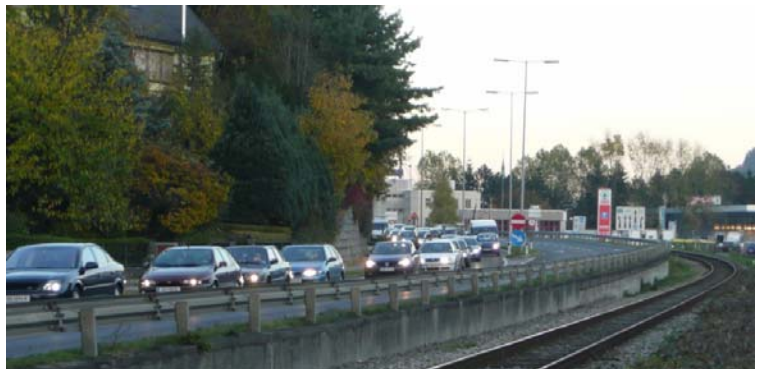
Verschlimmerung durch den Westring: Stau aus Linz: Puchenu - Richtung Ottensheim

Den Westring als Lösung für die fallweise Stauproblematik auf der Rohrbacher Bundesstraße darzustellen, war kühn und falsch. Wenn Politiker und Bürger von rationalen Überlegungen geleitet wären, müssten jetzt alle aufatmen. Wieso?